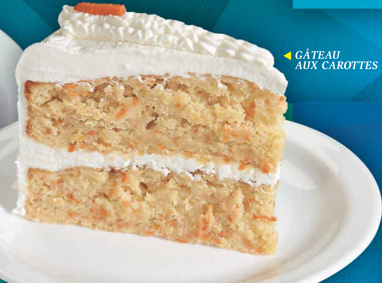
◀ GÂTEAU AUX CAROTTES ————— 3,99